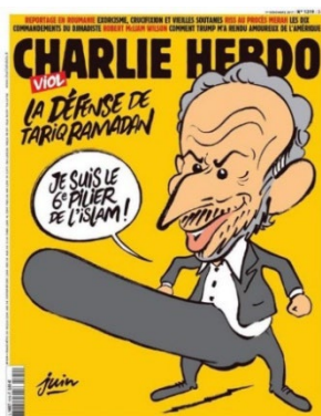
Figure 2: « Je Suis le Sixième Pilier de L'Islam »

Subsidiairement, Tariq Ramadan est un philosophe, un écrivain et un professeur suisse qui parle à beaucoup de gens sur les sujets politiques et philosophiques. Tandis que certains pensent qu'il accepte plusieurs nouvelles croyances, beaucoup des critiques de Ramadan expriment qu'il est un démagogue et islamologue qui manipule ses partisans en se servant de sa religion pour augmenter son soutien. Son grand-père était Hassan Al-Banna, un fondateur du groupe des Frères Musulmans Égyptiens. Quelques-uns de ses adhérents pensent qu'il ignore « le caractère militaire et violent » du groupe. 10 Récemment, il a déclenché une polémique quand il