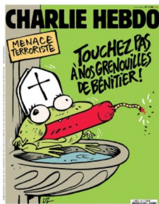
Figure 3: « Touchez pas à nos Grenouilles de Bénitier ! »

discuté les perspectives de Charb, l'auteur de cet extrait, Boris Foucaud, insère son opinion sur la liberté d'expression quand il commente « la liberté d'expression empêche tout dogme extrémiste ou totalitaire de s'installer dans la durée. » 22 Foucaud défend la liberté d'expression avec la justification qu'il vise à arrêter les groupes de trop contrôler. La Figure est une bande dessinée religieuse qui correspond avec ce qu'elle argumente. 23 L'image d'une grenouille qui est dans un bénitier est une image satirique de l'expression négative, « grenouille de bénitier », ce qui signifie une personne qui est très religieuse, particulièrement associée avec le catholicisme. Françoise Danflous, un auteur des extraits pour les sites web, commente sur la bande, en disant que l'image représente les menaces terroristes contre l'église. La grenouille représente « une catégorie de fidèles catholiques bornés et ridicules » et les bombes signifient les « fidèles