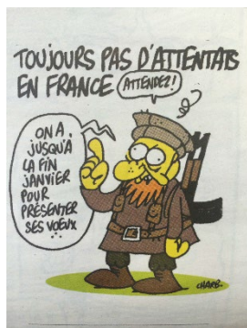
Figure 4: "Toujours pas d'attentats en France ?"

En répondant aux arguments opposants de Charlie, les dessinateurs de l'hebdomadaire font preuve d'une opinion inflexible sur leurs intentions de ses dessins. Le directeur de Mediapart, un site-web d'information, accuse les dessinateurs de Charlie Hebdo de participer « à une campagne « générale » de « guerre aux musulmans ». » 26 Le directeur, Edwy Plenel n'est pas d'accord avec les moyens d'aborder le problème de terrorisme dans les publications de Charlie Hebdo. Par ailleurs, Plenel souligne comment les dessins satiriques de Charlie sont trop provocants en plus d'ajouter que Charlie possède seulement un but : « la diabolisation de tout ce qui concerne l'islam et les musulmans. » 27 Il mentionne que personne ne peut savoir où se situe l'entreprise de Charlie Hebdo en termes de valeurs politiques, à cause de ses dessins qui sont trop